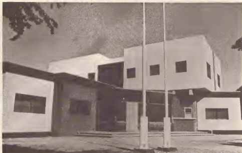
Edificio nobo di departamento pa cuida social ta ofrece mehor facilidadnan pa pueblo.

Conciente di e necesidatnan social di e Pueblo Arubano, Gobierno Insular a empeña tur esfuerzo pa cumpli cu esakinan. Un total di 500 casnan nobo pa pueblo a worde construi na Noord, Tarabana y Madiki.